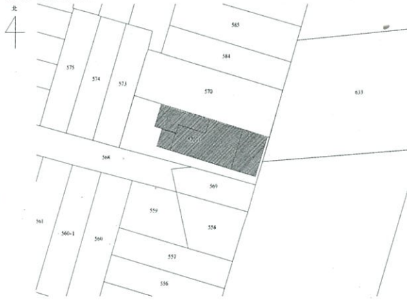
位置圖 比例尺 1/500