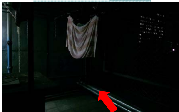
走到曬衣空間的後方