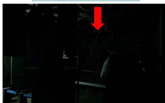
走進曬衣空間的中間