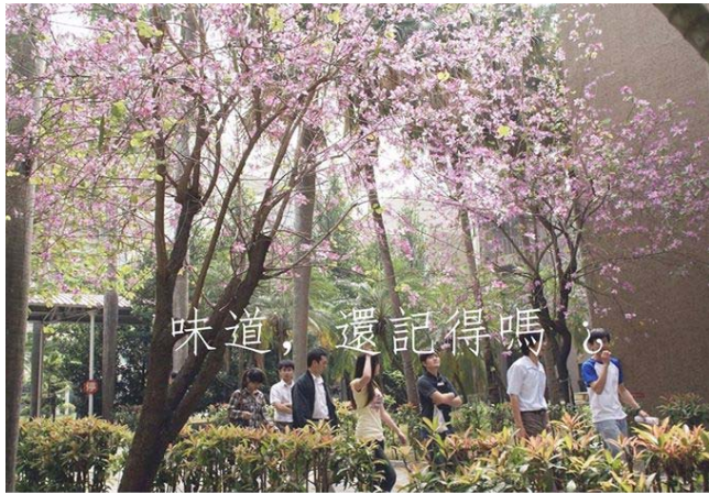
藝文講座 - 『藝啟合作』校園巡演計劃