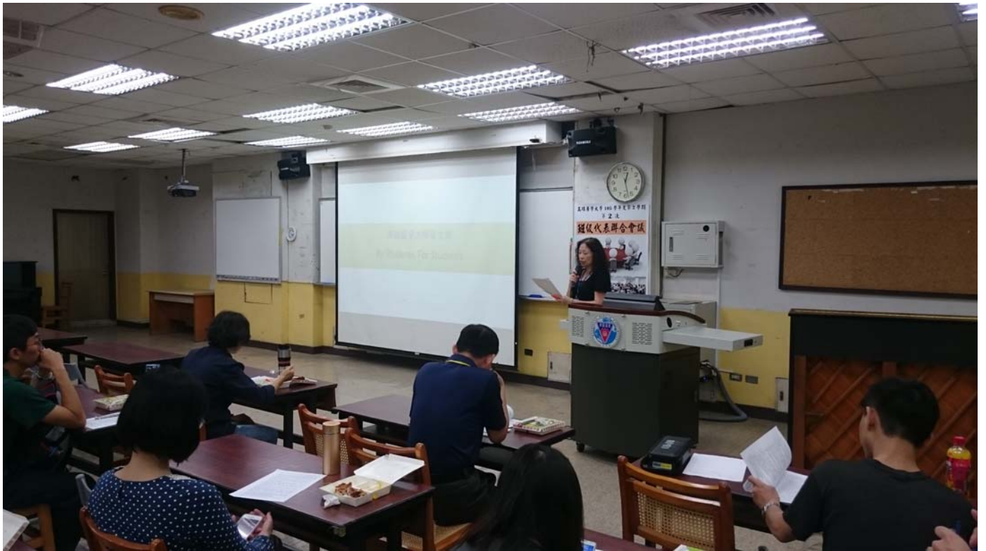
生輔組補充報告(2017.3.28 於 CSB-101)