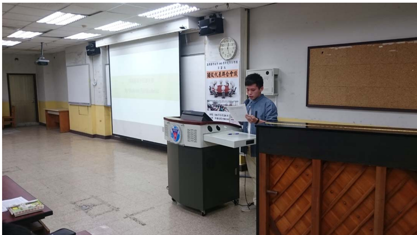
代聯會主席報告(2017. 3. 28 於 CSB-101)