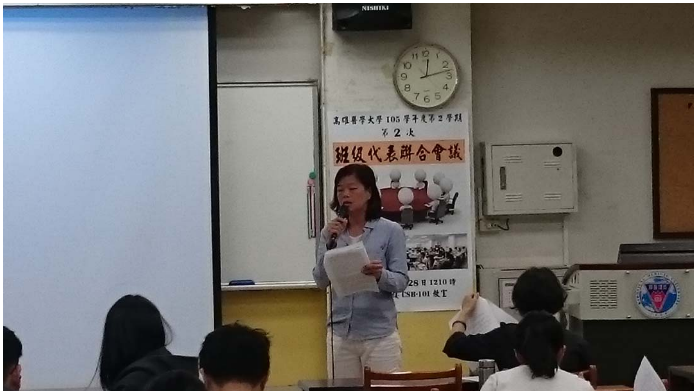
軍訓室報告(2017. 3. 28 於 CSB-101)