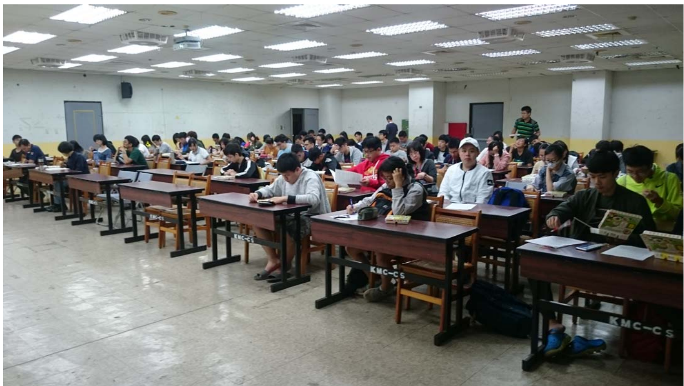
第一次代聯會出席狀況(2017.3.28 於 CSB-101)