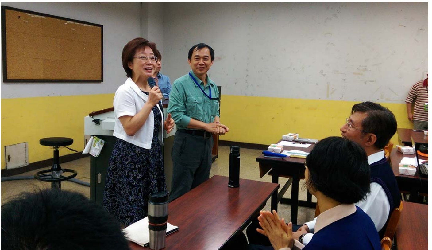
總務處宣導(2017. 2. 21 於 CSB-101)