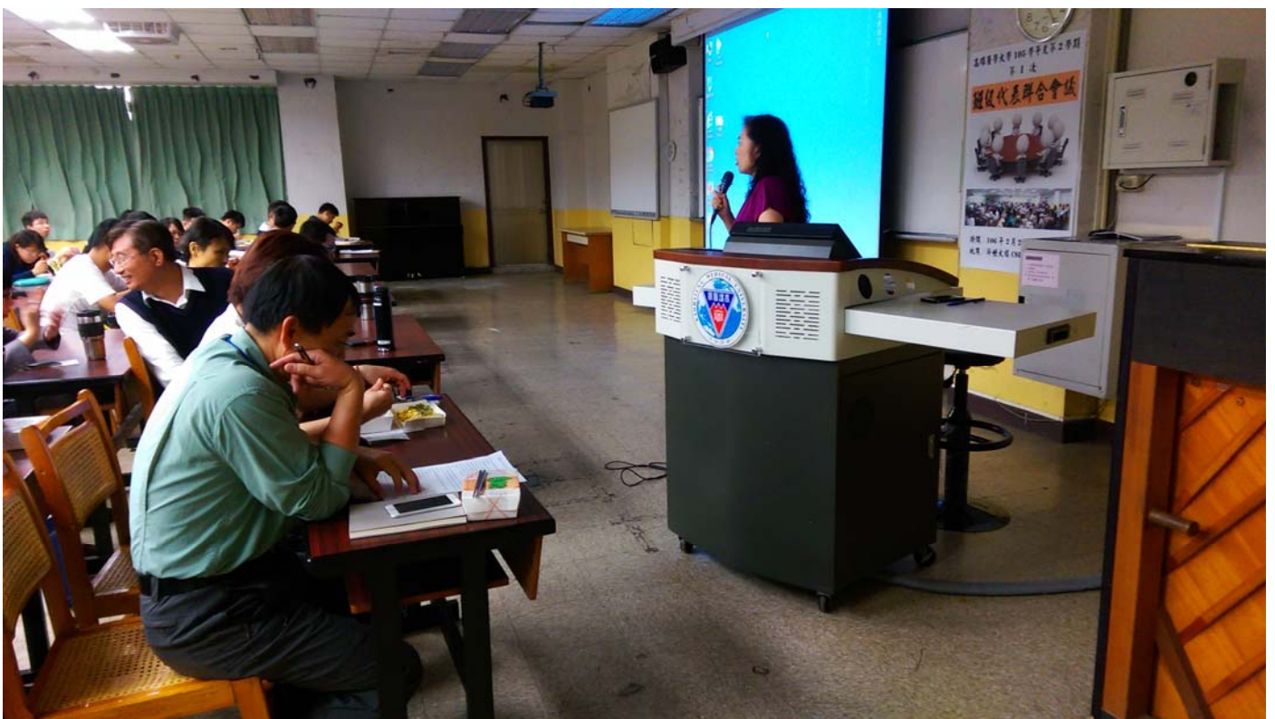
生輔組報告(2017. 2. 21 於 CSB-101)