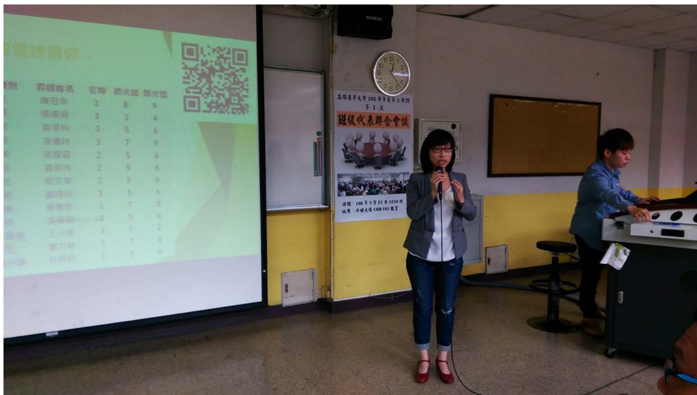
通識中心報告(2017. 2. 21 於 CSB-101)