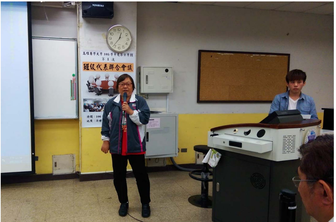
課外組報告(2017. 2. 21 於 CSB-101)