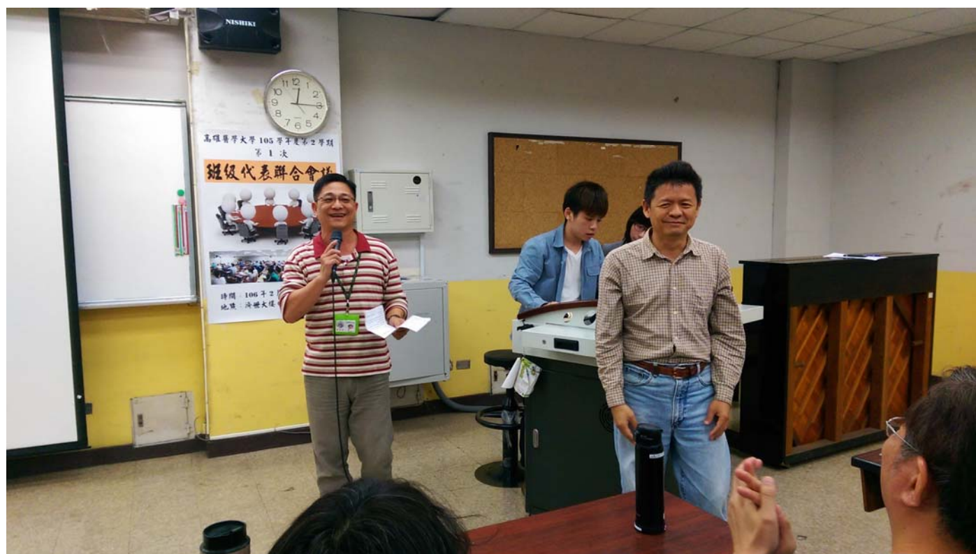
軍訓室報告(2017. 2. 21 於 CSB-101)