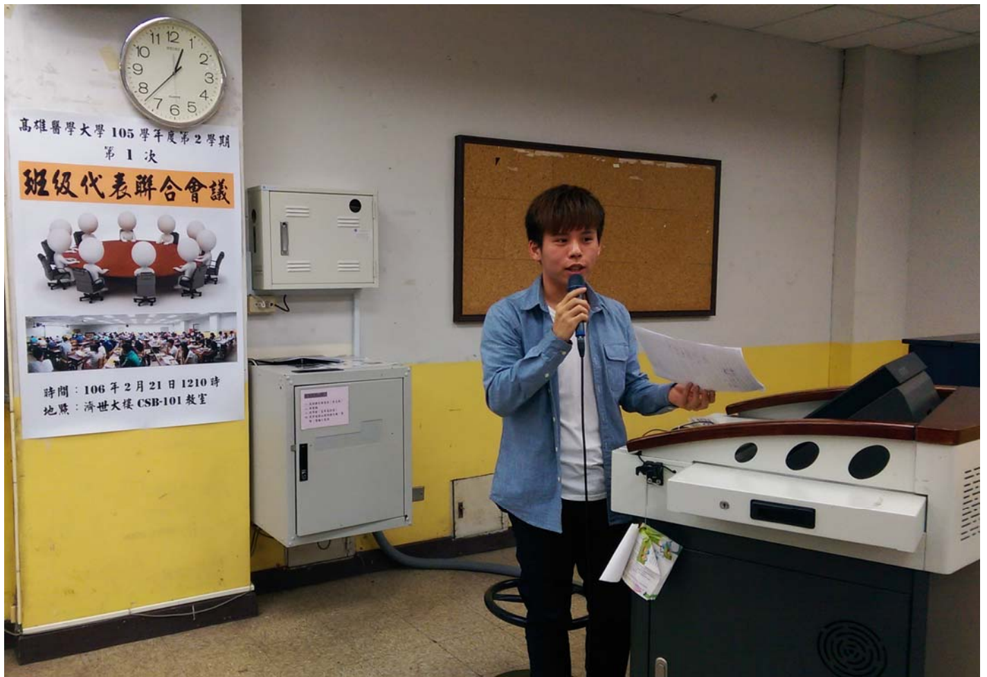
代聯會主席報告(2017.2.21 於 CSB-101)