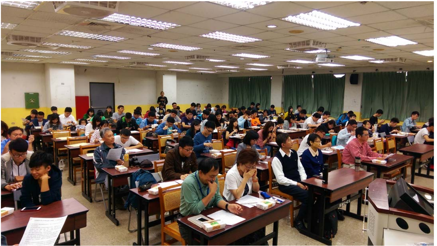
第一次代聯會出席狀況(2017. 2. 21 於 CSB-101)