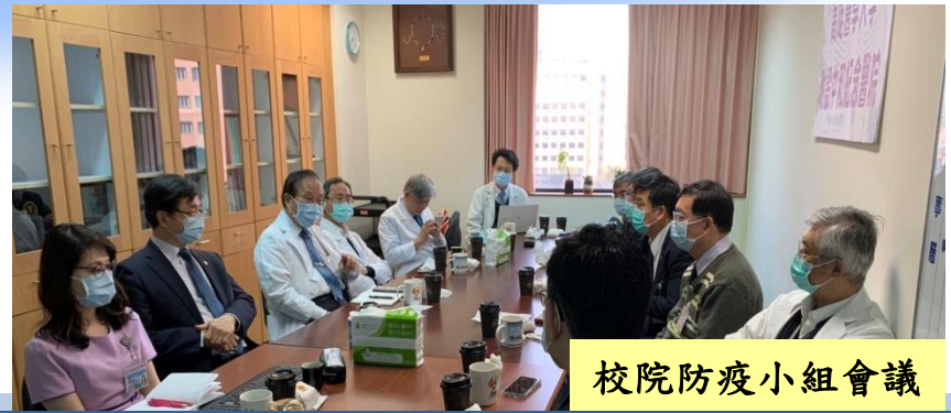
校院防疫小組會議