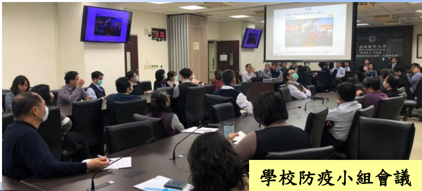
學校防疫小組會議

109.05.25 第廿二次防疫小組會議 109.06.08 第廿四次防疫小組會議