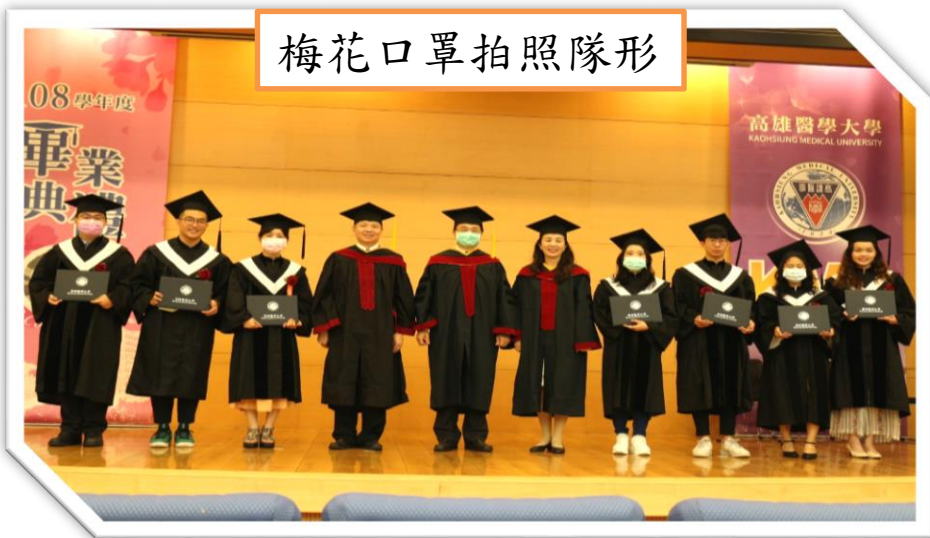
梅花口罩拍照隊形

本校繼2003年SARS後，第二次因疫情取消聯合畢業典禮，改由各所自辦小型畢業典，6月7日開放畢業生家長進入校園拍照留念，並邀請陳建仁前副總統錄製畢業祝福，高雄醫學大學董事會陳建志董事長、鐘育志校長、楊俊毓副校長、余明隆副校長、洪文俊副校長、許博翔副校長也透過錄影方式為畢業生獻上滿滿的祝福