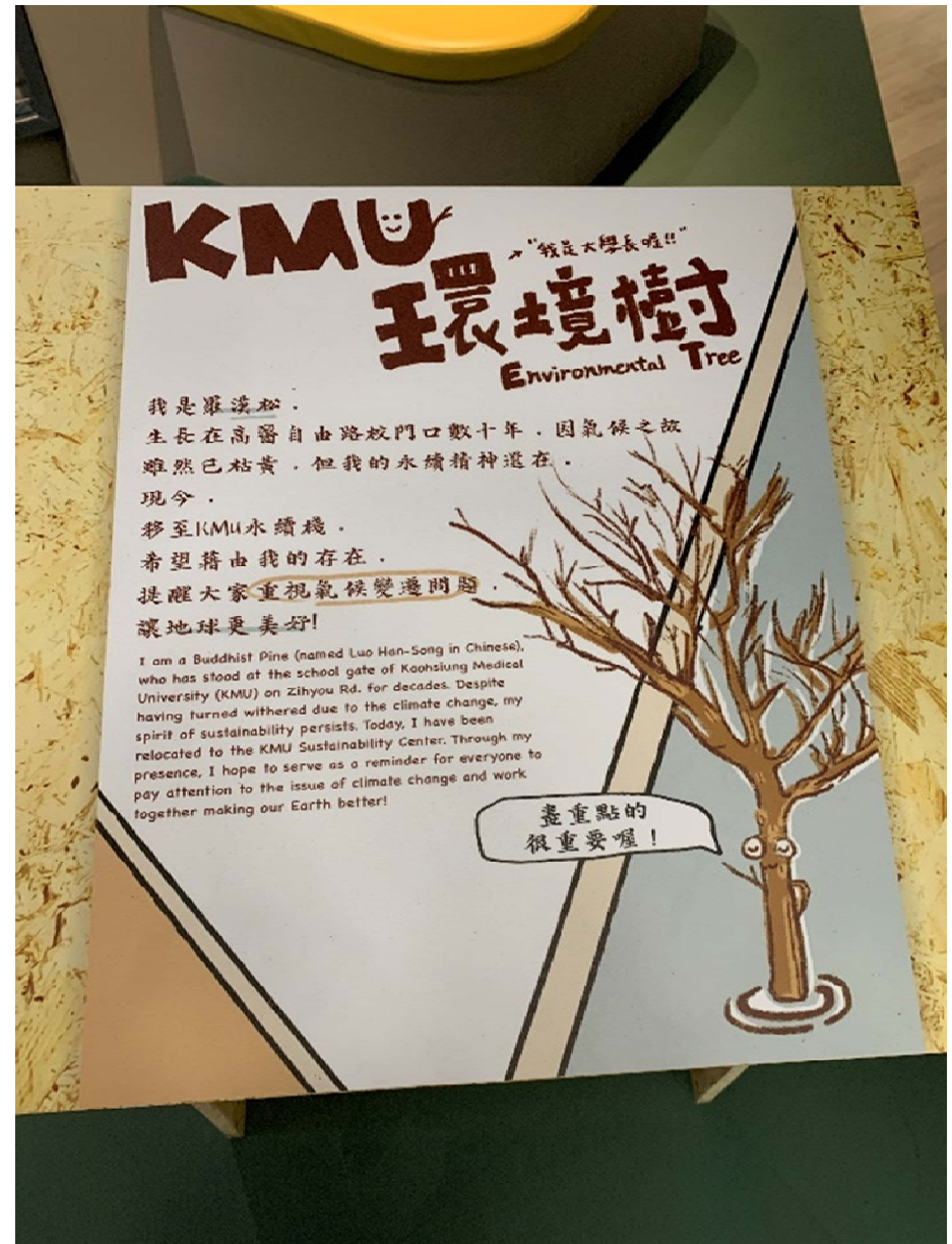
KMU 環境樹 -將原生長在自由路校門口數十年已枯黃之羅漢松移至永續棧內