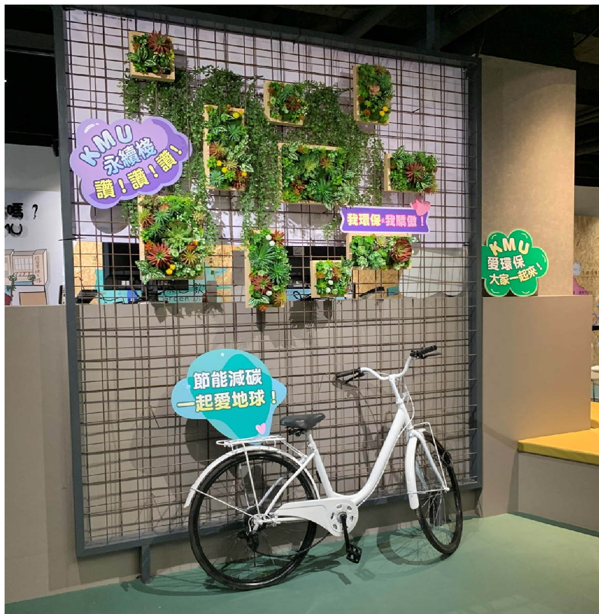
永續棧網美牆 -永續棧一進門就可以看到此牆，布置成爲師生可以拍照打卡的網美牆!