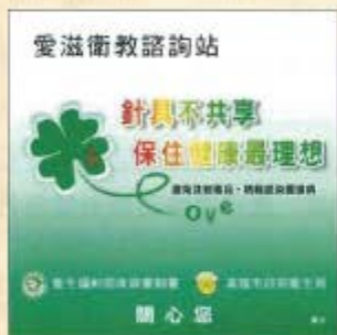
(清潔針具交換點標識)

目前本市各區衛生所及指定的藥局有提供清潔針具交換及回收服務，針具自動服務機台設置於衛生所、藥局、醫療院所及公園等，提供民眾便民服務。